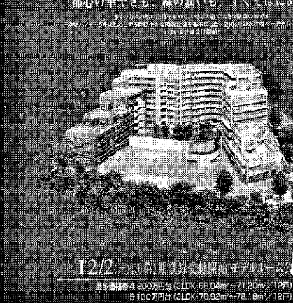
売り出しチラシには「ウォーターマックス・パイプテクター」の魅力をPR、販売の大きな武器になっている

「ウォーターマックス・パイプテクター」のデモ機を使用し、来場者にも実際に公開を指している。急成においしい水を体験して頂長中の「新日本建物」の分譲物件で、千葉県浦安市に立つ、この三月完成予定の「ラヴィッドル浦安（総戸数四千九戸）である。実際に飲んでみての感想と、このマンションは、パパシ府中紅葉ヶ丘（府中市、