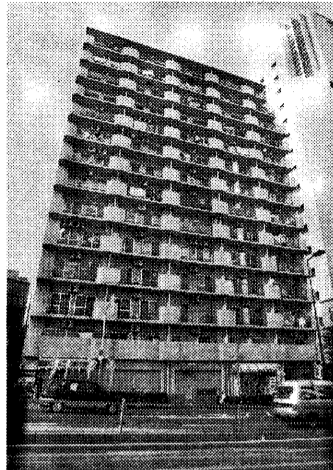
冬場の漏水もなくなった「カイサ土佐堀」

「設置後、一週間もたたないうちに赤水が止まった。その効果は、目に見えて効果はない。目に見えて効果はない。目に見えて効果はない。」