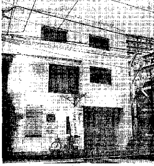
大田眼科診療所等が入っている大高院長が所有するビル

「このビルは十五年前に上、医療器具や医療用具など、お茶もおいしくなりました。お茶もおいしくなりました。お茶もおいしくなりました。お茶もおいしくなりました。」 「このビルは十五年前に上、医療器具や医療用具など、お茶もおいしくなりました。お茶もおいしくなりました。お茶もおいしくなりました。お茶もおいしくなりました。」 「このビルは十五年前に上、医療器具や医療用具など、お茶もおいしくなりました。お茶もおいしくなりました。お茶もおいしくなりました。お茶もおいしくなりました。」 「このビルは十五年前に上、医療器具や医療用具など、お茶もおいしくなりました。お茶もおいしくなりました。お茶もおいしくなりました。お茶もおいしくなりました。」