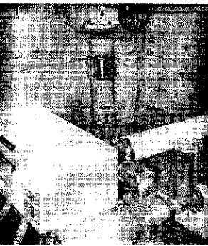
パイプテクターの設置状況