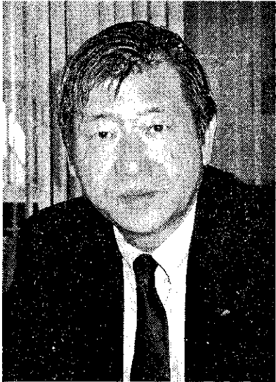
市場も考も市熊野社長

「黒さびの体積は赤さびの約十分の一で、配管の閉塞が大きく軽減できるほか、強度も向上する。新設の配管であれば、将来にわたり赤さびの発生を防止できる。設置は配管外部へ機器の取り付けだけで工事や断水が不要なことから、費用は通常の配管更新工事に比べ、